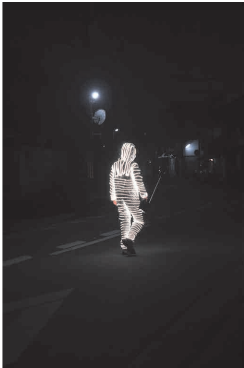
《光年》 パフォーマンス、 2024年