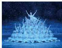
「くるみ割り人形」©古都栄二（テス大阪）

舞踏家。NPO法人LAND FES 代表。2005年より山海塾に舞踏手として参加。「金柑少年」「卵熟」「かげみ」「とぼり」「ARC」「TOTEM」などの主要作品に出演中。2011年よりLAND FESを主宰し、パフォーマンスを通して共生社会の推進を目指す様々な活動を展開する。2018年より、障がいの有無を越えて共にダンスを創る「スクランブル・ダンスプロジェクト」を率いる。NYのシアターカンパニーPhantom Limb Company「Falling Out」、作曲家Paola Prestini「Houses of Zodiac」に出演するなど、海外アーティストとのコラボレーションも多数。Tokyo Tokyo FESTIVAL スペシャル13「Tokyo Real Underground」キュレーターを務める。