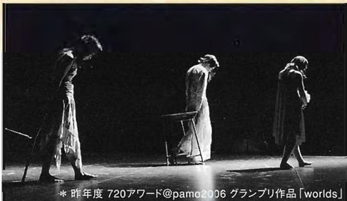
* 昨年度 720アワード@pamo2006 グランプリ作品「worlds」

2人の振付家によるコンテンポラリーダンス・ユニット。劇団hmpに所属していたメンバー3名によって結成、独自の活動を開始。ダンステクニックだけにとらわれず、音や照明、美術の作る空間にダンサーがどのように存在できるか、またそれらが生みだす時間やリズムに重きをおいた創作活動を行っている。2004年12月dance circus28で「...st.」を発表。以降、[踊りに行くぜvol.6vol.7関西選考会]や[神楽坂die pratz ダンスが見たい新人シリーズ4]にノミネート。2006年6月[dance box selection15]に選出。7月には[720アワード@pamo]でグランプリを受賞。現在大阪・京都を中心に活動中。