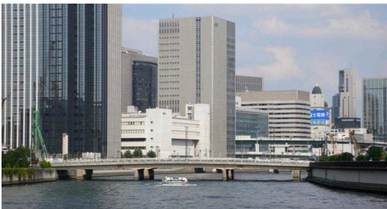
かつて蔵屋敷が林立した跡に、現在は高層ビルが林立