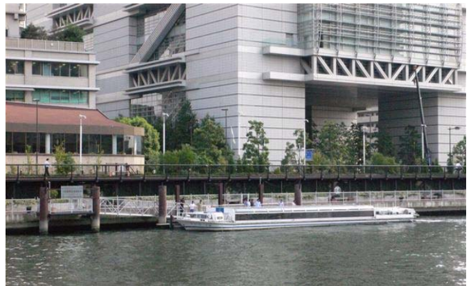
国際会議場前棧橋

運航コース、解説場所、古地図他の参考文献等を記載した資料を作成し、参加者に配布する