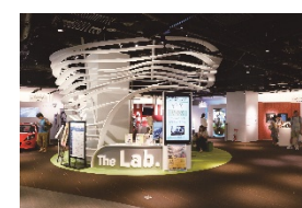
ナレッジキャピタル The Lab. ナレッジキャピタル 2F

2013年4月オープン。大阪の玄関口グランフロント大阪の中核をなす知的創造・交流の場。ナレッジキャピタルとは施設の名称であり、運営組織であり、活動自体である。オフィス、サロン、ラボ、ショールーム、シアターなどの施設を持ち、それらを有機的に連動させながら企業人、研究者、クリエイター、一般生活者などの行き交うさまざまな知を結び合わせて新しい価値やイノベーションの創出を目指す。