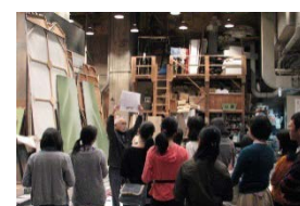
NPO 法人人形浄瑠璃文楽座 「そうだ文楽へ行こう！！ワンコインで文楽」 (国立文楽劇場のバックヤードツアー)

関西経済同友会の提言にもとづき、2014年に公益財団法人 関西・大阪 21世紀協会内に発足。市民や企業からの寄付によって関西のさまざまな芸術・文化を支援する100%民間の取り組み。プールされた寄付金から支援が必要な団体や個人を公募で選び助成を行うほか、寄付ごとに個別のファンドを設け、寄付者の希望にそって公募による助成も行っている。これまで約1億円の寄付をあつめ、約70の団体・個人に支援を行ってきた。天満天神繁昌亭で開催される「上方落語若手噺家グランプリ」やNPO法人人形浄瑠璃文楽座が行う「そうだ文楽へ行こう！！ワンコインで文楽」など、大きな成果を上げている。